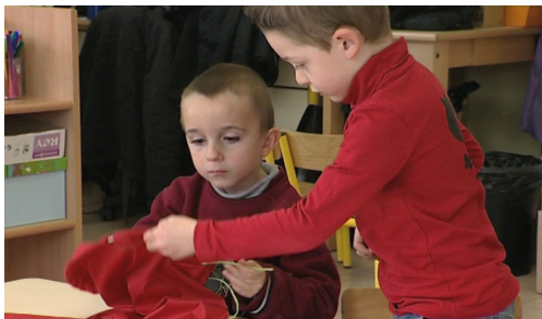
BSD Fabriquer une manche à air