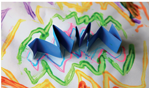
Productions des élèves de l'école maternelle d'application Helvétie de Besançon, tirées d'Activités graphiques à l'école maternelle. Premiers pas dans les arts visuels, Béatrice Laurent © CRDP Besançon 2012