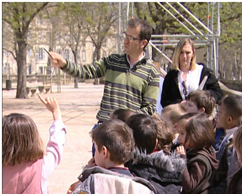
BSD Visite des jardins de la Fontaine