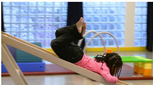
Les parcours d'activités motrices : « Phase de structuration en moyenne section »